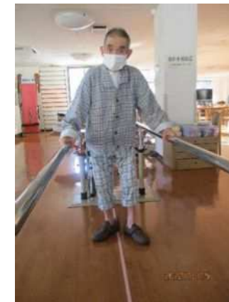
歩行訓練頑張っています♪♪