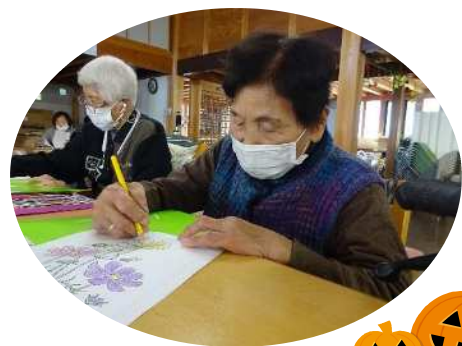
花を題材にぬり絵をしています。