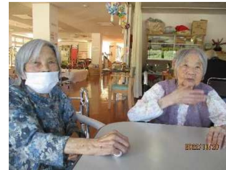
「今日は天気がいいな〜」 話がはずみます