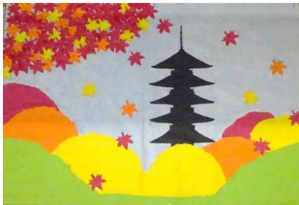
10月の壁画「秋の法隆寺」