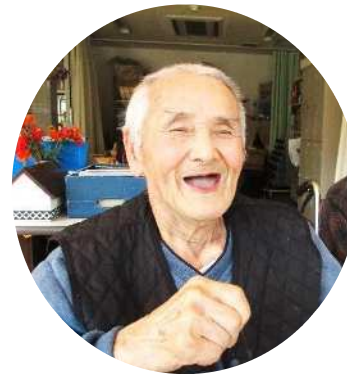
何か楽しいことがあったのかな？